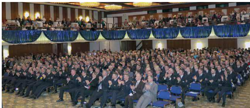
Eine ideale Kulisse für den Festakt bot der Festsaal des Maritim Hotels. 1000 Menschen verfolgten die Ernennungsfeierlichkeiten.