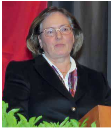
Innenstaatssekretärin Manuela Söller-Winkler beglückwünschte die neuen Polizeimeisterinnen und -meister. Foto 2: Gründemann

Lübeck-Travemünde – Zweieinhalb Jahre haben sie während der Ausbildung auf das Ziel hingearbeitet: Ende Januar wurden 124 junge Nachwuchspolizisten endlich erlöst. Im großen Saal des Maritim Hotels erhielten die freudig strahlenden 30 Frauen und 94 Männer den Lohn für ihre Mühen und wurden in einem Festakt zu Polizeimeisterinnen und -meistern ernannt. Und auch die anwesenden Führungskräfte der Landespolizei mit Landespolizeidirektor Ralf Höhs an der Spitze freuten sich bei der Übergabe der Ernennungsurkunden an die erfolgreichen Absolventen, denn die jungen Beamtinnen und Beamten verstärken seit dem 1. Februar sowohl Einzeldienststellen im Lande als auch die 1. Einsatzhundertschaft der PD AFB. Von der Qualität des Nachwuchses zeigte sich Innenstaatssekretärin Manuela Söller-Winkler bei ihrer Festansprache überzeugt. „Die jungen Leute sind die Garantie, dass die Landespolizei ihre Aufgaben auch weiterhin professionell und engagiert wahrnimmt“, sagte Söller-Winkler. Sie beglückwünschte den Polizeinachwuchs, gab ihm jedoch mit auf den Weg, wachsam und kritisch zu sein und sich stets gesunden Menschenverstand zu bewahren. Das Lernen höre mit dem Ende der Ausbildung nicht auf. „Der Polizeiberuf ist ein Erfahrungsberuf“, sagte die Staatssekretärin. Die Beamtinnen und Beamten benötigten vor allem ein ausgepräg-