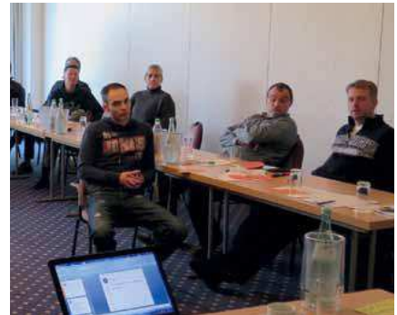
Im Workshop wurde eifrig diskutiert.